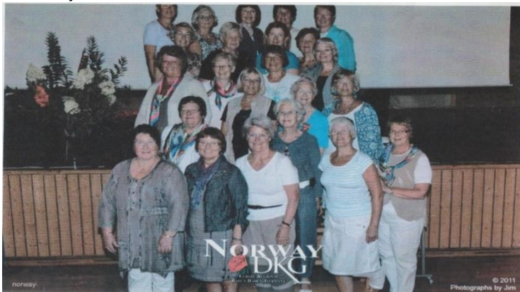
Fra Baden Baden i 2011