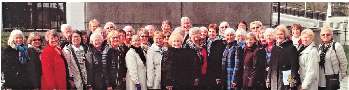
Deltakerne på landsmøtet i Sandvika 2015